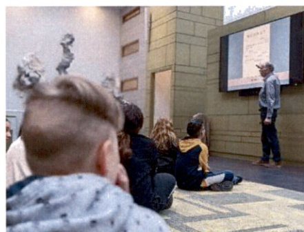
Educatieprogramma over de tweede wereld oorlog en Oral History

De volgende speerpunten en prioriteiten zijn voor het taakgebied dienstverlening in 2022 gerealiseerd: