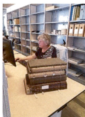
Foto's RAR: Ontsluiting van papieren archieven: kaarten project Tiel en bevolkingsregisters gemeenten