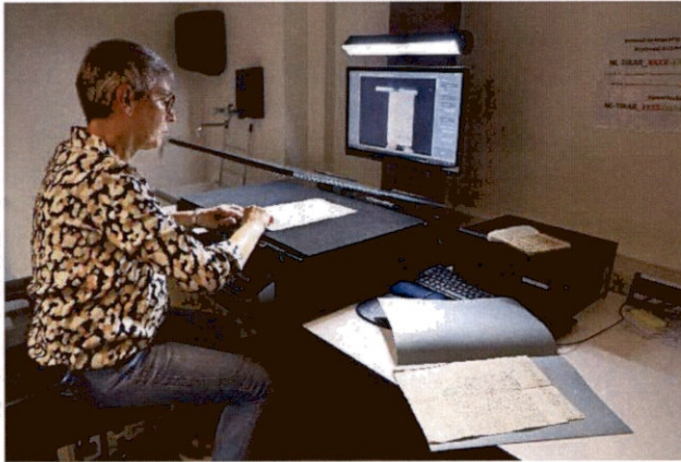
Medewerker RAR aan het digitaliseren voor publieke verzoeken