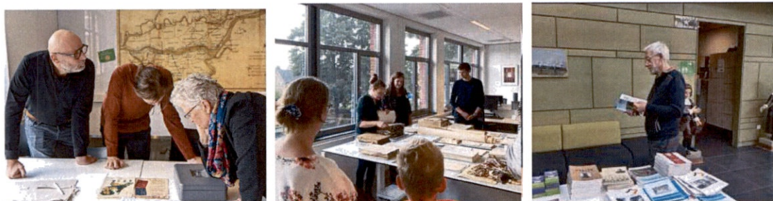
Foto's RAR Open dag vlnr: puzzelen bij de Break-in box, rondleiding langs de het werkveld RAR, boekenverkoop.

De bereikte resultaten in het archiefprogramma zijn binnen de financiële kaders gerealiseerd. De financiële paragrafen laten cijfers en kengetallen zien, waaruit blijkt dat de financiële positie van het Regionaal Archief Rivierenland zich binnen de gestelde kaders en normen begeeft. We realiseren in 2022 een positief resultaat van € 179.617,-. Lagere personeelslasten door meerdere vacatures en lagere lasten van kantoor- en reiskosten als gevolg van het meer structureel, gedeeltelijk thuiswerken hebben hier mee te maken. Toch is een van de belangrijkste oorzaken van dit resultaat de besparing die is gerealiseerd door het uitstellen van de vervanging van onze inventaris (ca € 90.000,- aan lastenvermindering). Dit, in combinatie met de extra inkomsten door onze dienstverlening en toezichtstaken richting GR-en, zorgt voor een positief resultaat.