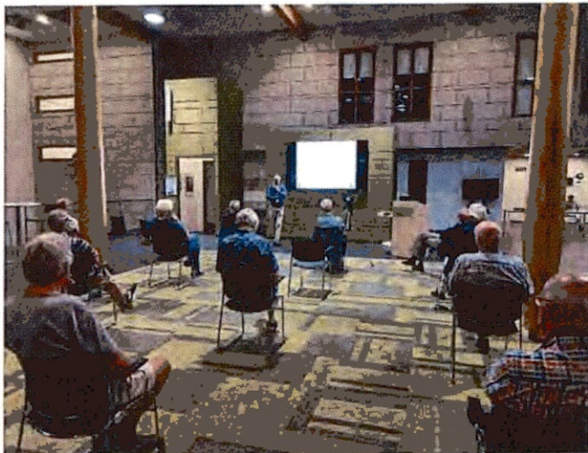
Eerste lezing tijdens Corona-maatregelen