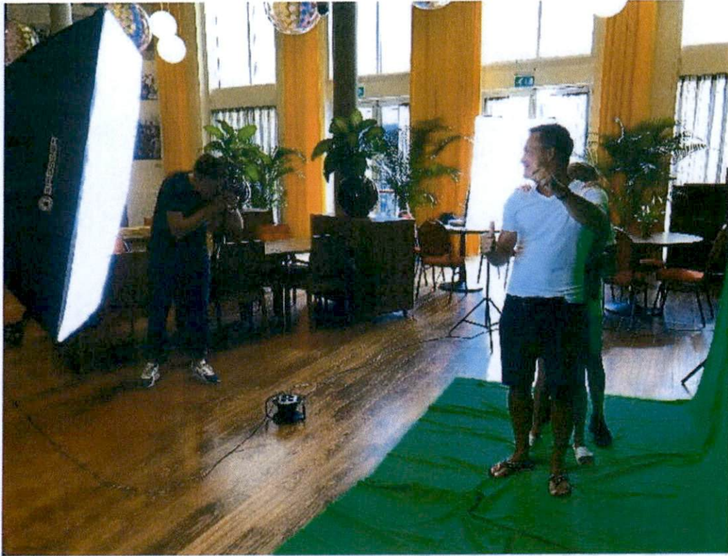
Zomertour langs alle RAR gemeenten