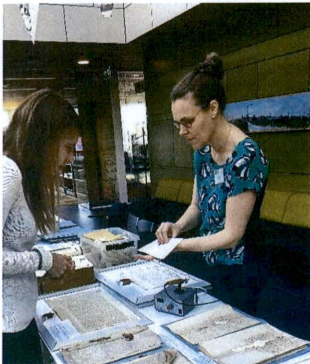
Voorbeelden van conservering en restauratie