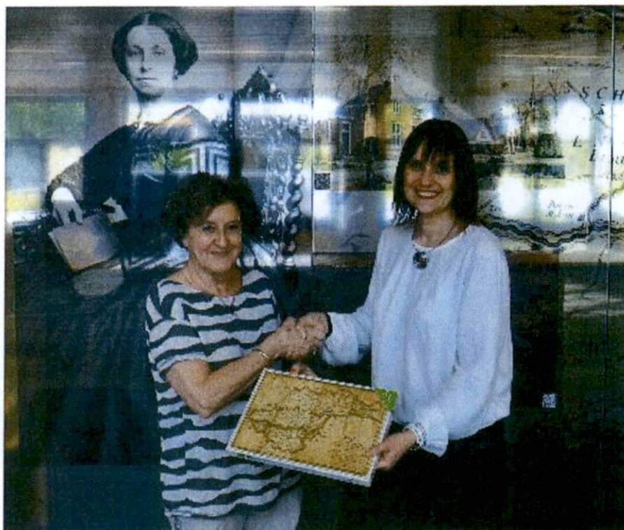
Eerste bezoeker voor Lingewaalse archieven

Medio 2019 zijn officieel de archieven van de voormalige gemeente Lingewaal overgebracht naar het RAR als onderdeel van de per 01.01.2019 heringedeelde gemeente West Betuwe. Dat bracht ook het nodige archiefwerk met zich mee, met name inlopen van de achterstanden in inventariseren, indexeren, digitaliseren en (digitaal) beschikbaar stellen. Werk dat in 2019 is begonnen en in jaren daarna vervolg gaat krijgen.