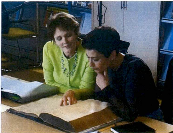
Opnamen voor Verborgten verleden