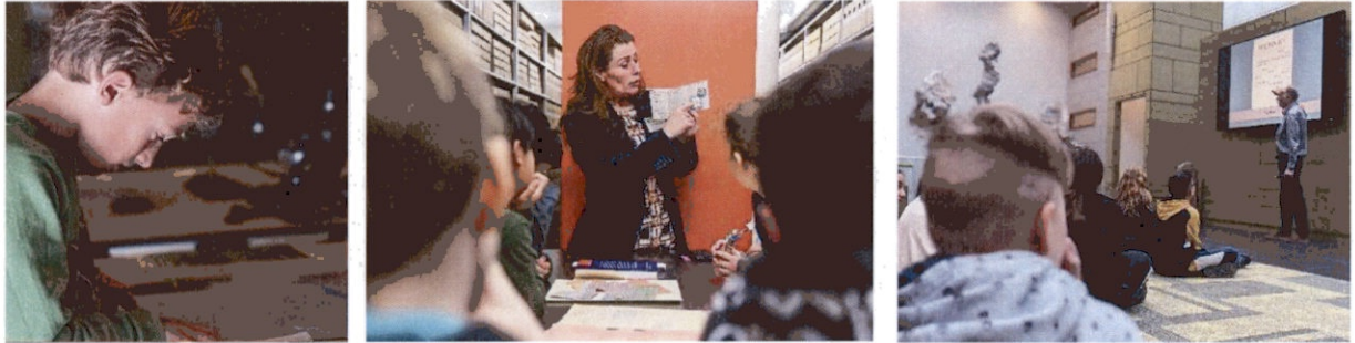
vlnr: Educatieprogramma over de tweede wereld oorlog en Oral History