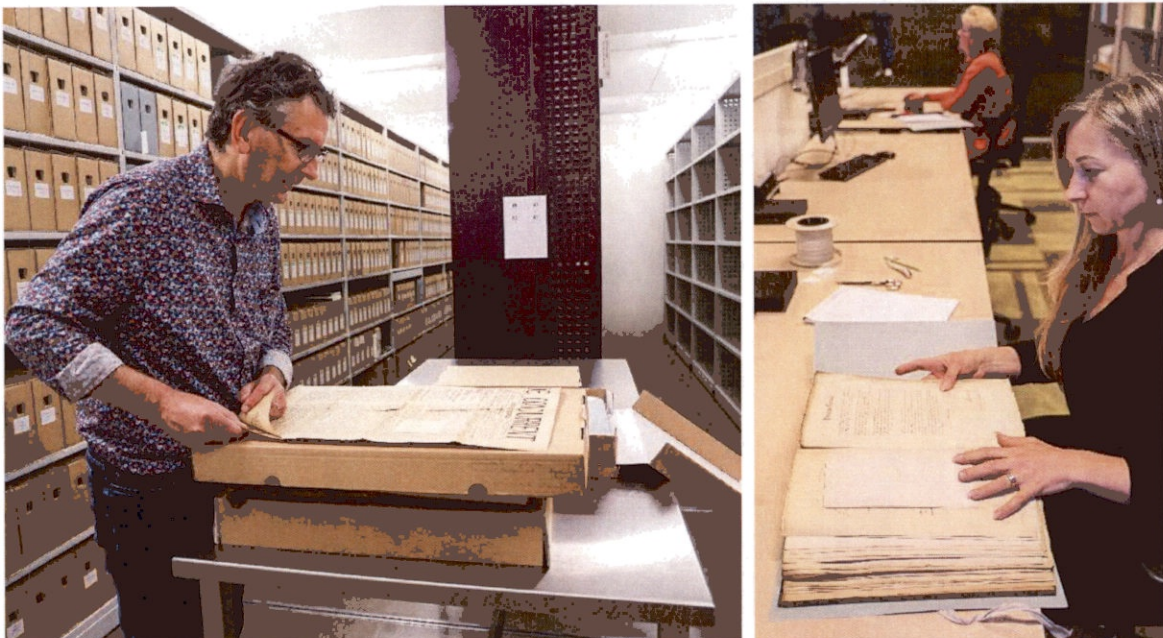
vlnr: de bibliotheek bij het RAR en vrijwilligers aan het werk bij het RAR