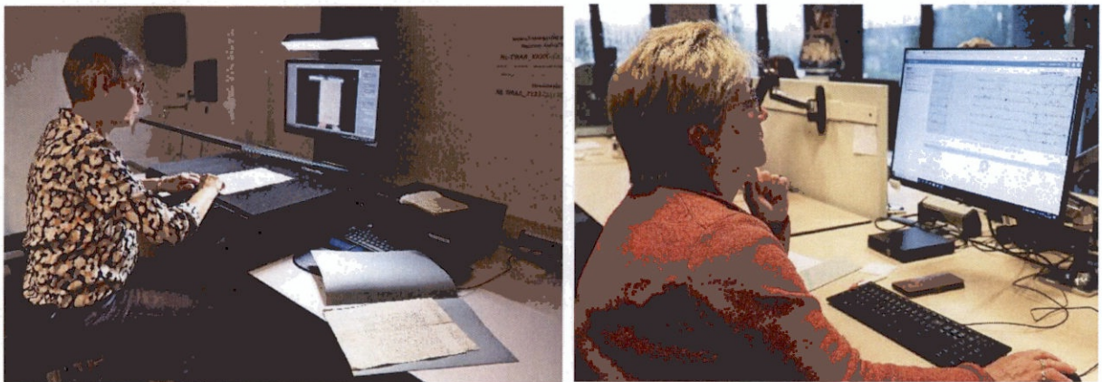
vlnr: Digitalisering van stukken en vrijwilliger aan het werk bij het RAR