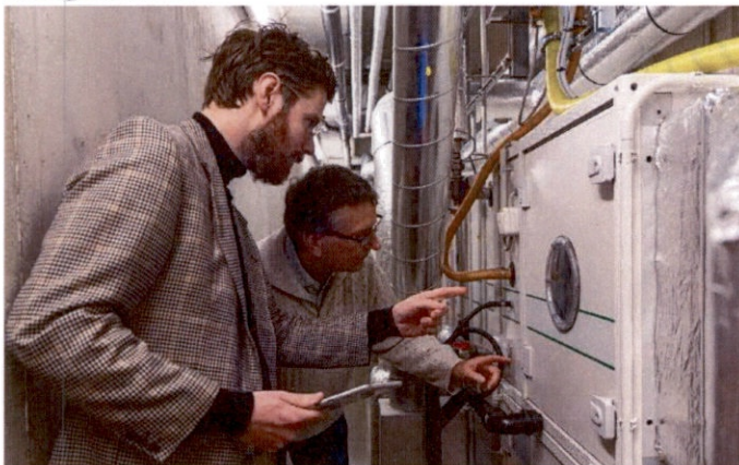
Inspectie bij de installaties van de depots

Regulier en groot onderhoud gebeurt door de VvE op basis van het Meerjarenonderhoudsplan (MJOP) wat gezamenlijk binnen de VvE is opgesteld. Jaarlijks wordt door het RAR een bedrag betaald aan de VvE voor de uitvoering van het MJOP. In het MJOP is rekening gehouden met de bouwkosten index inflatie en heeft een looptijd van 30 jaar. De Meerjarenonderhoudsbegroting (MJOB) wordt 2 jaarlijks geactualiseerd. Hierin worden uiteraard nieuwe technologische ontwikkelingen meegenomen.